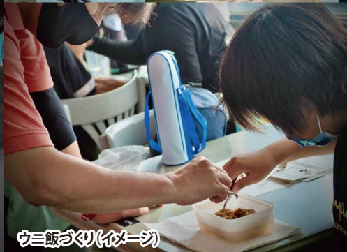
ウニ飯づくり(イメージ)