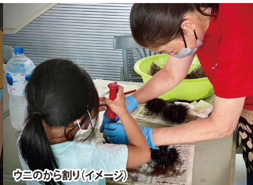
ウニのから割り(イメージ)